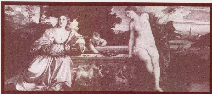
Tiziano Vecellio (1490-1576), Amor sagrado y profano.