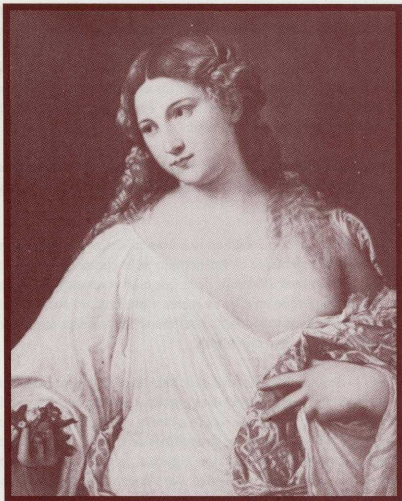
Tiziano Vecellio (1490-1576), Flora.