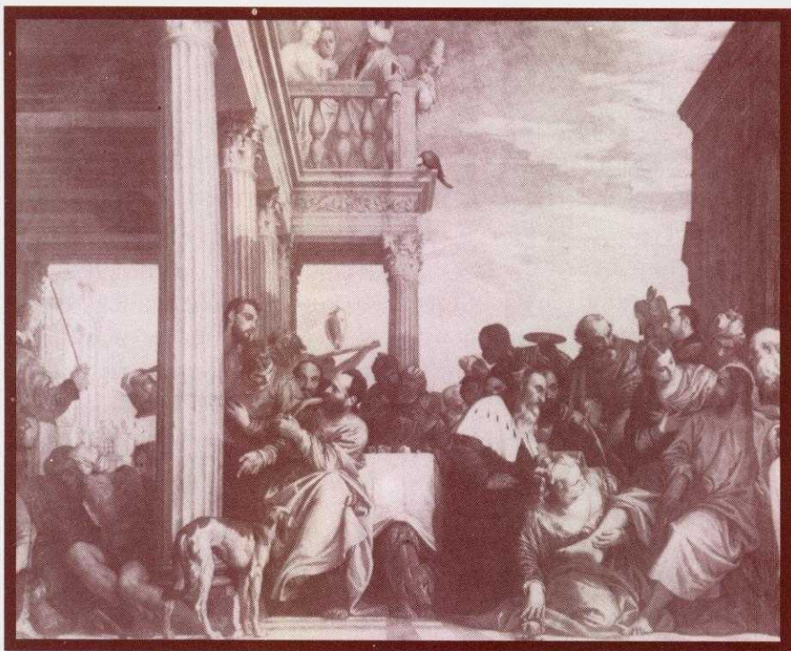
Paolo Veronés (1528-88), Fiesta en la casa de Simón.